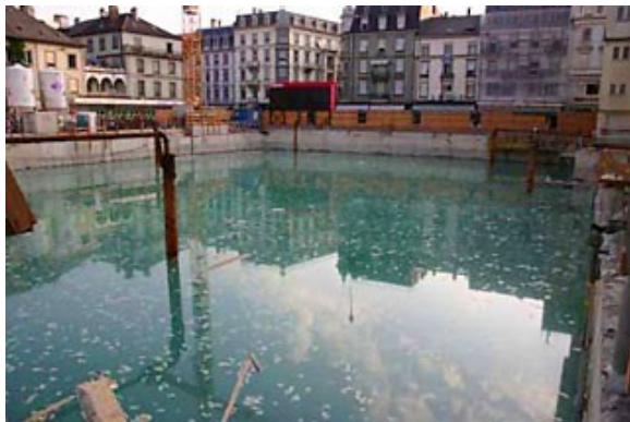
Grundwasser geflutete Baugrube