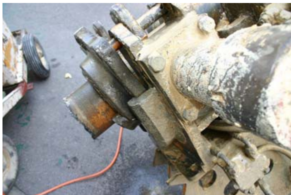
Unter Wasser abgetrenntes Bohrrohr